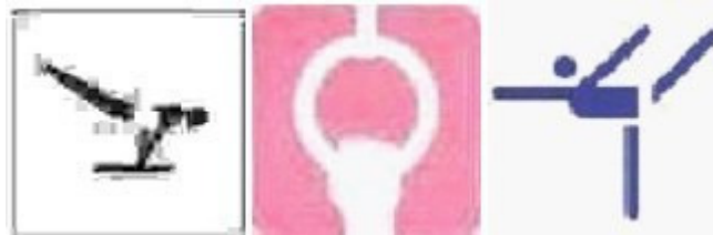
Tokyo 1964 / Mexico City 1968 / Munchen 1972 – Montreal 1976

Drept urmare, din 1964 si pana in prezent, pictogramele au devenit o obisnuinta a spatiilor olimpice, fiind parte integranta a organizarii olimpice si pastrate de colectionari, asemenea Tortelor, Posterelor, Medaliilor, Programelor, Biletelor de intrare, Cardurilor ID, Diplomelor, Cartilor Postale, Insignelor (cele oficiale, desigur) etc