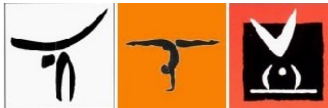
Barcelona 1992 /Atlanta 1996 / Sydney 2000

Lucrul la pictograme a inceput in decembrie 1986 și finalizat in aprilie 1987, cuprinzand 30 de figure, inclusiv 23 pentru sporturile oficiala, patru pentru sporturile demonstrative și trei pentru Torta, maraton si polo pe apă. După două runde de triere, in mai 1987 ele au fost lansate oficial.