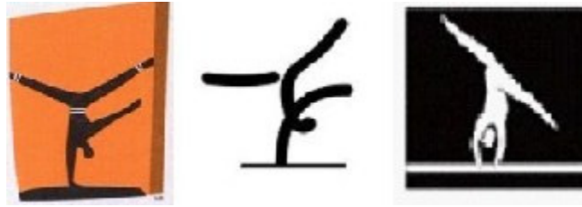
Atena 2004 / Beijing 2008 / Londra 1012

sa intalnim pictograme inspirate din elementele Greciei antice, simplitatea formelor umane venind de la figtinele cicladice, expresia artistica derivand din vasele de ceramica neagra, cu reprezentari ale organismului uman, cu singura linie care defineste detaliile.